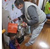
プレゼントは 何かな...