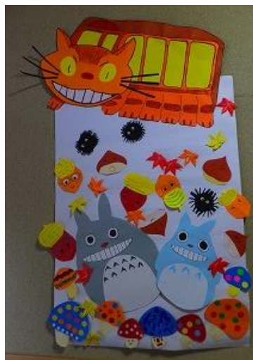
D-キャリアの「クリスマスマルシェ」にも展示しました