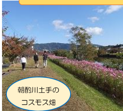
朝酌川土手の コスモス畑