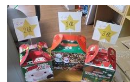
ゲームの 景品だよ